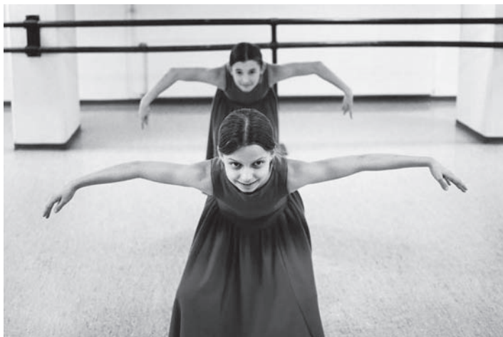
Die Axelrod Tanzschule ist an der Eröffnung mit von der Partie.

Das Festival eröffnen wird die Produktion «Chur tanzt». Unter