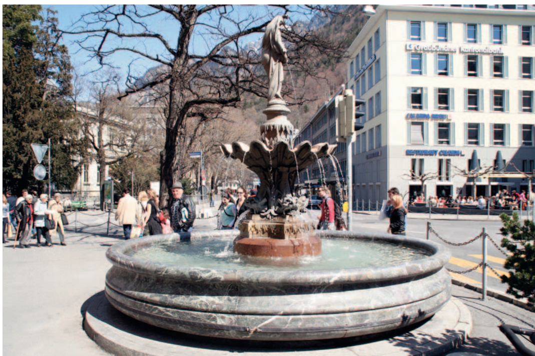
Seit 1880 sprudelt «die Fontaine» aus buntem Savogniner Ophicalcit auf dem Postplatz.

Da die öffentlichen Brunnen im Laufe der letzten hundertfünfzig Jahre fast alle einstigen Funktionen einbüßten, verloren die meisten Brunnen in diesem Zeitabschnitt ihren Sudelbrunnen. Einer der letzten existiert noch beim Hegisbrunnen. Wie sehr einzelne Stadtbewohner die verschwundenen Sudelbrunnen vermissen, und wie unnachgiebig andererseits die Behörden die Sauberkeit des Hauptbrunnens verteidigten, zeigt eine Episode aus dem Jahre 1933. Das Polizeiamt