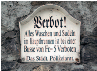
Die Tafel am Brunnen an der Bondastrasse erinnert an vergangene Zeiten.