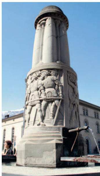
Der Donna Lupa-Brunnen vor dem Stadthaus am Untertor wurde vor 100 Jahren gebaut.

Bedeutung als heute. Sie waren Wasserlieferanten für die Hausfrauen, weshalb die meisten Brunnen mehrere Rohre besaßen und entsprechende Eisengestelle, auf die beim Wasserholen die Eimer gestellt werden konnten. An den öffentlichen Brunnen wurde auch ein grosser Teil der Hauswäsche gewaschen. Der Stadtbrunnen diente den Bauern, die ihr Vieh zum Teil in Ställen inmitten der Stadt hielten, als Tränke für Pferde, Kühe, Schafe und andere Haustiere. Besonderen Wert stellten die Brunnen für einzelne Handwerker dar wie etwa den Schmied, vor allem aber den Küfer. Er liess Holzgefässe wie Fässer und Zuber im Wasser des Brunnens aufschwellen.