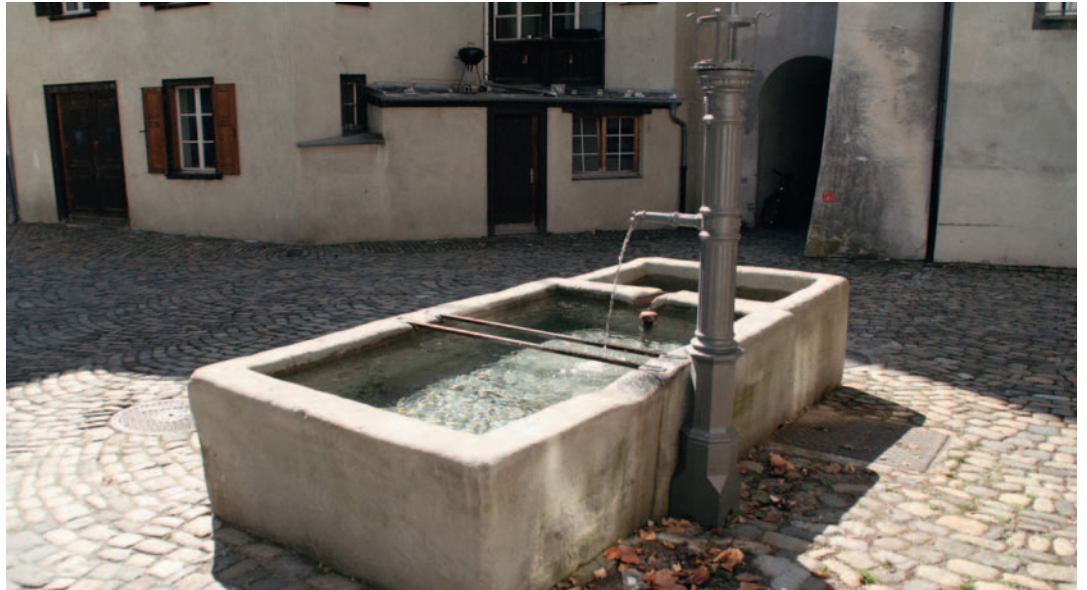
Der Hegisbrunnen ist noch einer der wenigen Wasserspender mit einem Sudelbrunnen.

auferte einem Churer eine Busse von Fr. 3.30, «weil er sich wegen Verschwellens eines Holzzementfasses im Ochsenbrunnen eines Verstosses gegen die einschlägige Polizeiverordnung schuldig gemacht hatte». Gegen diese Verfügung erhob der Gebüsst Einsprache beim Stadtratsausschuss mit dem Hinweis, dass ihm eine andere passende Gelegenheit zum Verschwellen seiner Fässer – eben ein Sudelbrunnen – nicht zur Verfügung stehe. Die Einsprache wurde abgelehnt mit dem Argument, dass jede Verunreinigung des Hauptbrunnens