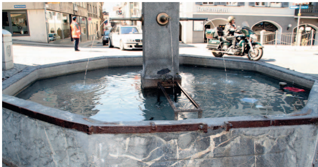
Der Zollhausbrunnen gehörte zu den wichtigsten Brunnen der Stadt. Nach 1903 wurde er umgebaut und der Sudelbrunnen verschwand.

Die öffentlichen Brunnen in der Stadt hatten bis weit ins 19. Jahrhundert eine völlig andere