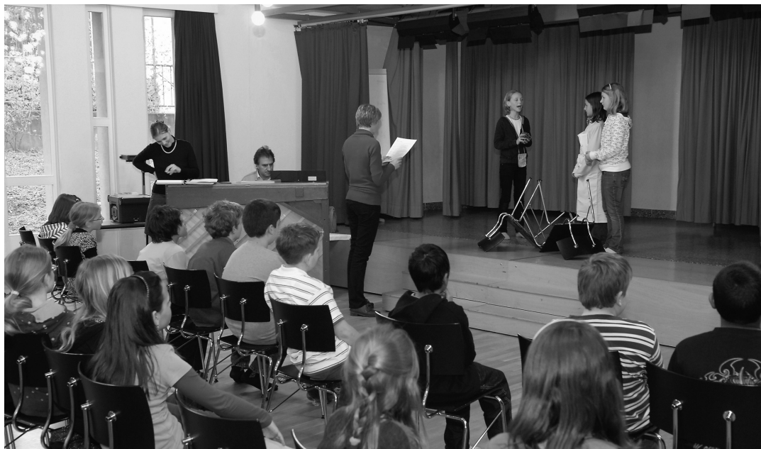
Ein besonderes Frühjahrskonzert: Mädchen und Knaben der Singschule üben das Singspiel «König Drosselbart» ein.