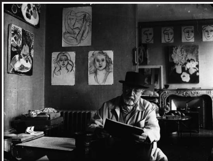
Jean Dubuffet (1901–1985), Maler.