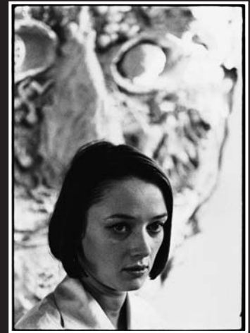
Niki de Saint Phalle (1930–2002), Künstlerin. Foto: Monique Jacot, 1963/64 in Soisy-Ecole.

Frau über Jahre hinweg zusammengetragene Kollektion. Meyer fasste eines Tages den Entschluss, zeitgenössische Künstler auf der ganzen Welt zu fotografieren. Die 80 Fotografien aus seiner Hand lagen über 20 Jahre vergessen in einer Schublade. 1995 erkrankte Meyers Frau Jacqueline an Krebs, und die beiden beschlossen, die Sammlung durch den Ankauf von Porträts anderer Fotografen zu ergänzen, um sie dann in ihrer Gesamtheit zugunsten einer Krebsstiftung zu verkaufen. Heute umfasst die im 2003 von Würth erworbene Sammlung rund 250 Fotografien von 42 Fotografen. Dabei liegt der Schwerpunkt auf der zeitgenössischen Fotografie. Nur vereinzelt ergänzen Klassiker wie das Porträt von