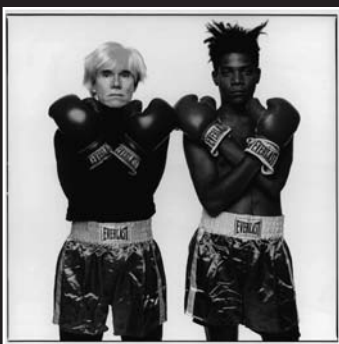
Andy Warhol (1928–1987) und Jean-Michel Basquiat (1960–1988).

Otto Dix, 1928 von August Sander (1876–1964) aufgenommen und damit das älteste Werk der Sammlung, das Repertoire. Die Ausstellung im Kulturforum Würth ist von Montag bis Freitag von 10 bis 17 Uhr, am Donnerstag bis 20 Uhr geöffnet. Der Eintritt ist frei. Führungen am 15. Januar, 12. Februar, 12. März, 9. und 30. April von 18.30 bis 19.30 Uhr.