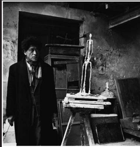
Alberto Giacometti (1901–1966), Bildhauer, Maler.

Salvador Dalí schaut mit weit aufgerissenen Augen in die Kamera. Nur sein Kopf ragt aus dem Wasser. «Dalí dans l'eau» lautet der Titel der 1953 entstandenen Schwarz-Weissaufnahme, die einst um die Welt ging. Das Bild des französischen Fotografen Jean Dieuzaide (1921–2003) hängt am Eingang zur Ausstellung «art faces – Künstlerporträts aus der Sammlung Würth». Die Liste der Porträtierten liest sich wie ein «Who is Who» der Kunstwelt. Alberto Giacometti kommt hier ebenso vor wie Joseph Beuys, Roy Liechtenstein, Jean Tinguely, Andy Warhol und viele andere mehr.