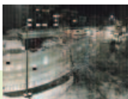
Jules Spinatsch: Temporary Discomfort Chapter IV, Pulver Gut, 2003, Inkjet Print

27. März bis 24. Mai, Vernissage 26. März, 19 Uhr