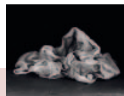
Bianca Brunner: Cover , 2009, Silbergelatine Print

19. Juni bis 12. September, Vernissage 18. Juni, 19 Uhr