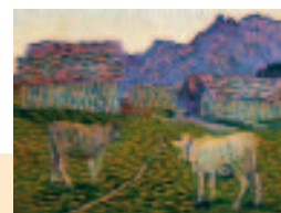
Giovanni Giacometti: Abend auf der Alp , 1906, Öl auf Leinwand

30. Januar bis 7. März, Vernissage 29. Januar, 19 Uhr