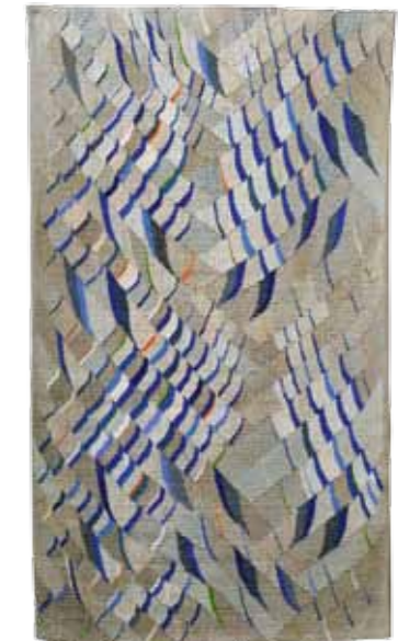
«Der fröhliche Wasserfall», 2011, 102 x 58 cm, Leinen, Baumwolle.

tigen Farben auffällt. Die Inspirationsquelle für ihre Kompositionen findet sie in der Natur, in den Bergen, die sie oberhalb ihres Elternhauses aufragen sieht, oder an den Flüssen und Bächen, die sich einen Weg durch die Landschaft bahnen. Der erste Impuls bedeutet Aufbruch zu einer spannenden Unternehmung, die mehrere Monate in Anspruch nehmen kann. Am Anfang steht noch nicht fest, wohin die Reise führt. «Wie der fertige Teppich einmal aussehen wird, weiss ich im Voraus nicht, bestimmt aber anders als geplant», sagt Cilia Unholz. Zuerst fertigt sie nur ungefähre Skizzen oder Collagen an. Sie brauche diese Freiheit, betont Textilgestalterin, um später genügend Spielraum für spontane Eingriffe zur Verfügung zu haben. Dann wird die Farbrichtung bestimmt, das Material ausgesucht und der Webstuhl eingerichtet. Cilia Unholz nimmt sich beim Weben viel Zeit, legt immer wieder eine Pause ein, um die Formen und Farben auf sich einwirken zu lassen. Laufend werden Entscheidungen getroffen, bis aus der ursprünglichen Idee ein harmonisches Ganzes geworden ist. ■