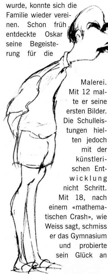
«Pétanquespieler», Skizze aus den Achtzigerjahren.