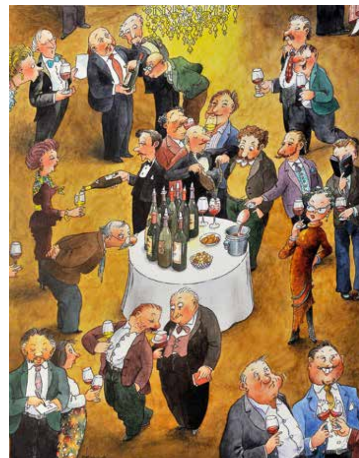
«Die grosse Verkostung», aus dem Buch «Weinfestival».

der Kunstgewerbeschule Zürich – mit deutlich mehr Erfolg.